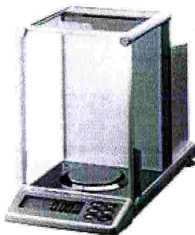
Рисунок 1 – Общий вид весов GH

Общий вид весов представлен на рисунке 1.